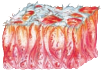
Nasenschleimhautschädigung/ Austrocknung und Entzündung

Es durchfeuchtet nicht nur nachhaltig die Schleimhäute, sondern beugt durch seinen hohen Anteil an antioxidativem Vitamin E neuen Infektionen vor und trägt zur Heilung der gestressten Nasenschleimhäute bei. Verkrustungen lösen sich, die Nasenatmung wird erleichtert, die unangenehmen Symptome einer trockenen Nase gehen spürbar zurück.